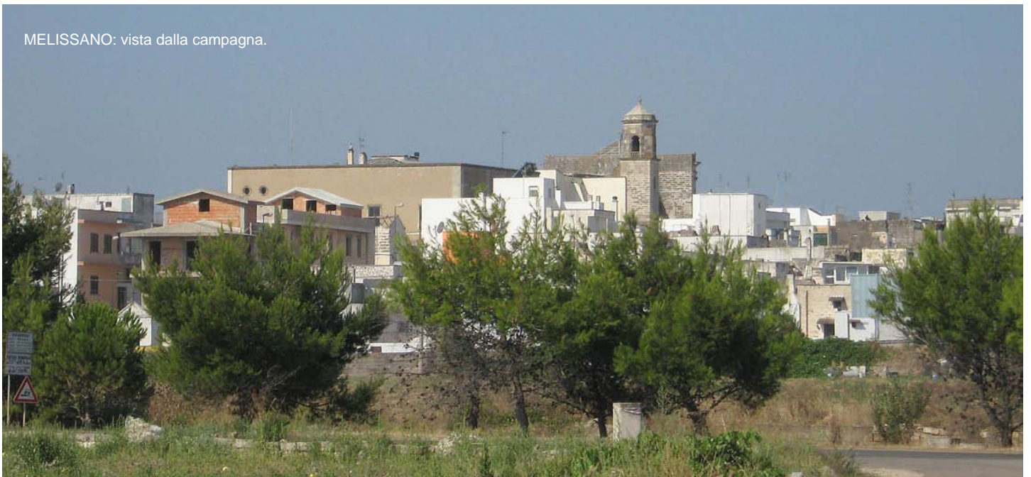
MELISSANO: vista dalla campagna.

Questo piccolo (sic!) aneddoto non dice forse che "vivono" e "viviamo", "respirano" e "respiriamo" aria..."viziata"?! ■