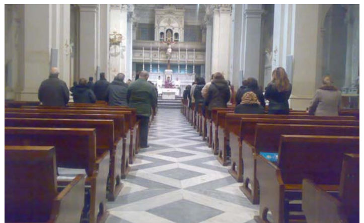
Primo giorno di Novena di Natale, 16 dicembre 2009 - ore 6 del mattino.