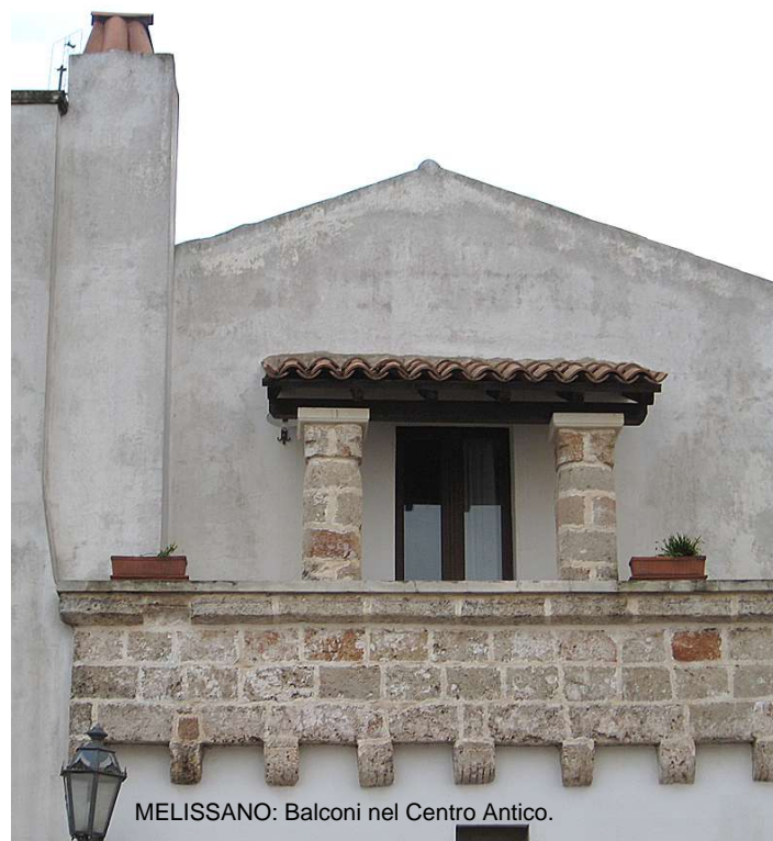
MELISSANO: Balconi nel Centro Antico.

Esauriti gli argomenti all'ordine del giorno, il parroco dichiara chiusa la seduta del CPP alle ore 21,15.